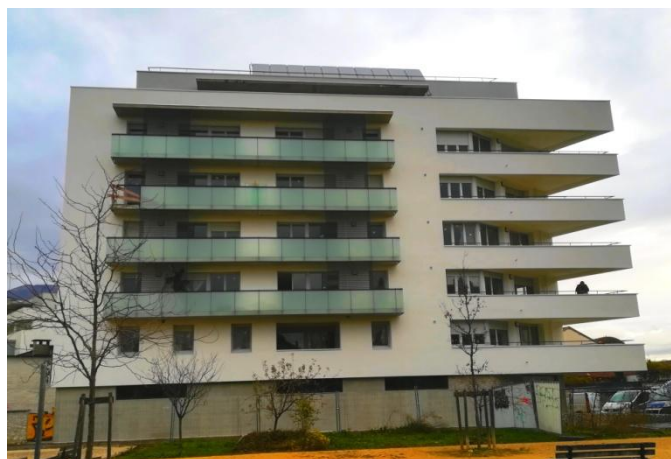
L'immeuble Actis 58 avenue Jean Perrot