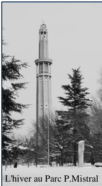
L'hiver au Parc P.Mistral