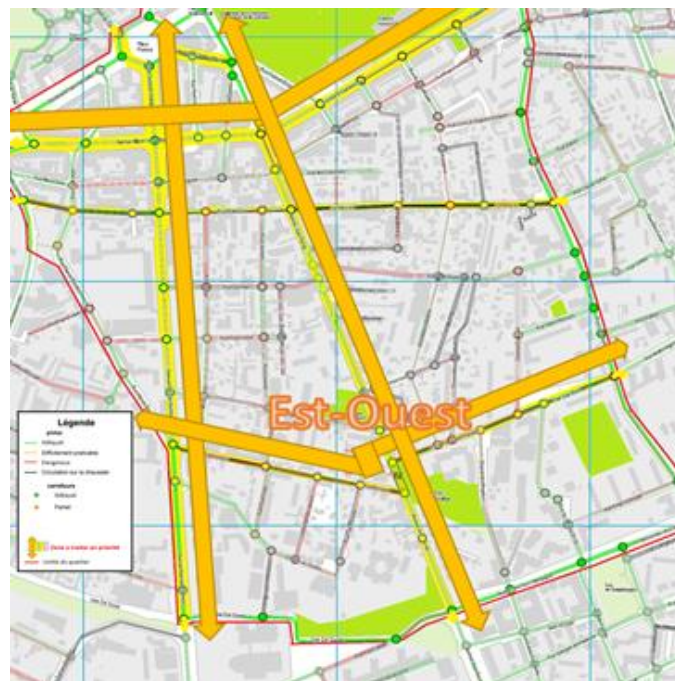
Figure 1 : Schéma des axes "Tempovélos" et de l'axe Vélos Est<->Ouest complémentaire

Ce nouvel aménagement temporaire sur l'axe (indiqué "Est-Ouest" sur le plan de la Figure 1) des rues Ponsard, Station Ponsard et Jean Bart permettrait la traversée d'est en ouest du quartier à vélo par l'intermédiaire d'espaces sécurisés. Ce nouvel axe desservirait un grand nombre d'établissements scolaires du quartier (Collège Munch, Externat Notre-Dame, Ecole Bajatière, Ecole Jouhaux, la Baja puis collège Vercors et Lycée Argouges...).