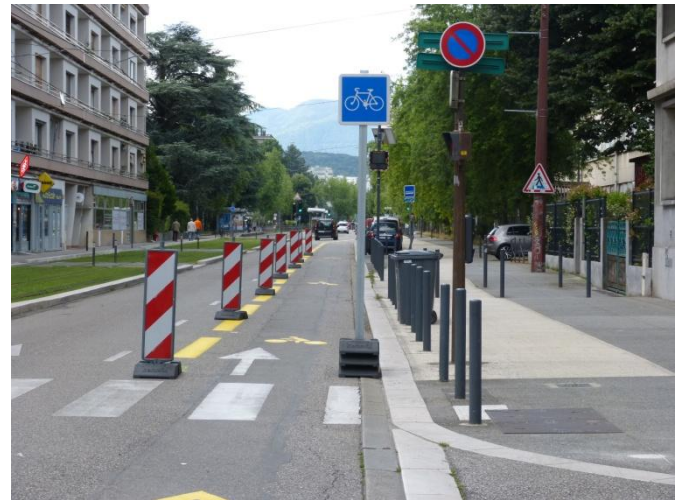
Le tempovélo sur Marcellin Berthelot

Nouvelle surprise le 9 juin, des balisettes rouges, de l'avenue Général Champon jusqu'à l'avenue Marie Reynoard délimitent une nouvelle voie Nord Sud.